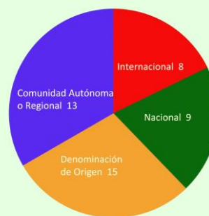
Distribución de los concursos de vinos en 2016, en función del ámbito de convocatoria

Al revisar la relación de concursos a los que se confiere reconocimiento, comprobamos que 8 son de ámbito internacional, 9 nacional y 28 se convocan en ámbito más restringido, 13 con participación regional o de la comunidad autónoma y 15 en los que los vinos del concurso serán exclusivamente de la Denominación de Origen correspondiente.